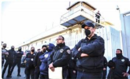
TIJUANA.- Se pide no amenazar a los agentes de custodia, hacer un diagnóstico de la situación y contratar más elementos para su fin.

Durante una manifestación realizada el 19 de abril de 2021, dicho personal reclamó sobre las con-